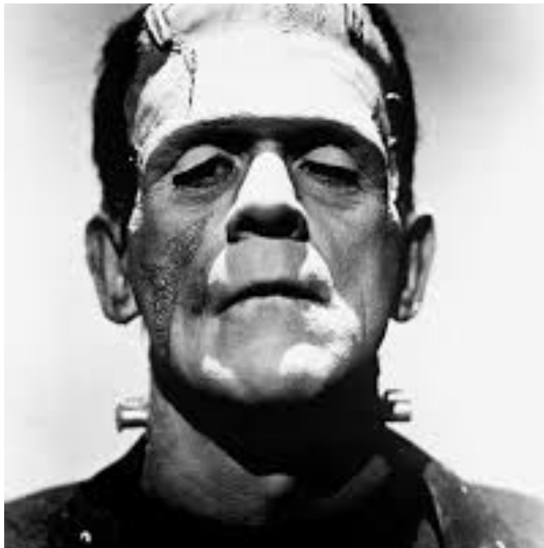
메리 셸리, 〈프랑켄슈타인〉